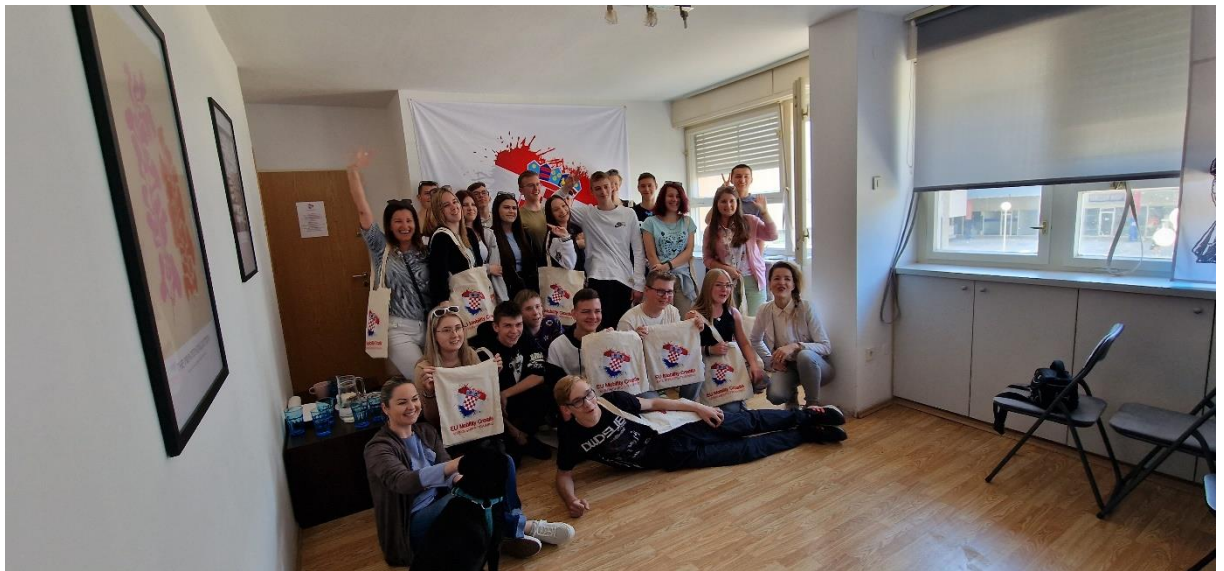
Pożegnanie w biurze EU Mobility Croatia