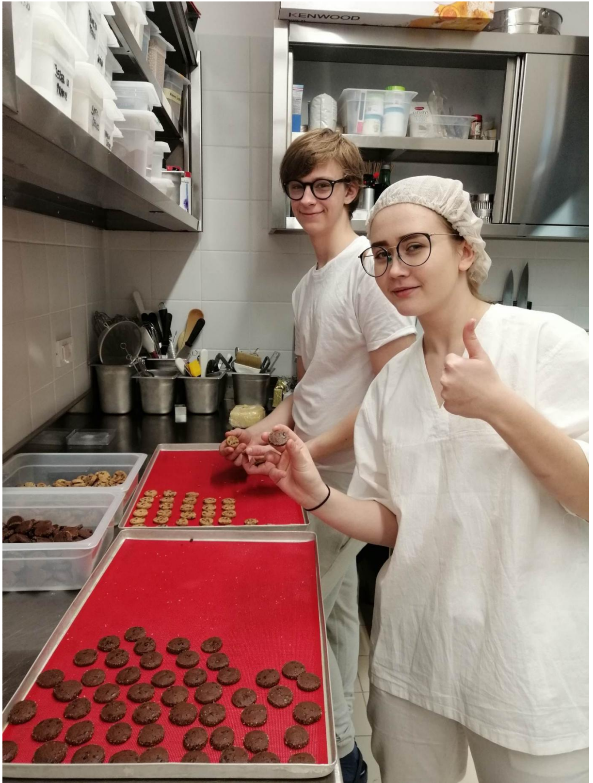
Cukiernicy w Hotelu Ambasador Split